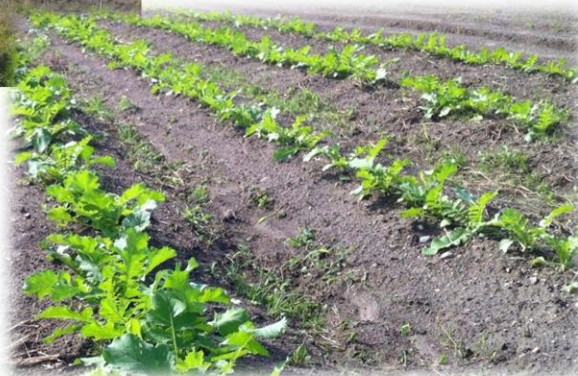
豊田市藤岡地区、猿投地区にて栽培中