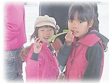
【子供が喜んで食べる野菜】