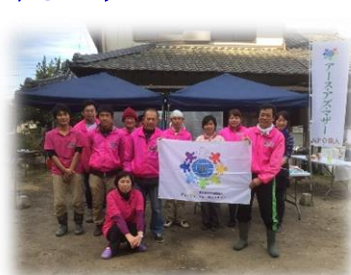
【私たちが作っています!】 アース・アズ・マザー農事業部

お米は昔ながらの手植え、手鎌刈り、はざがけ、天日干し、足踏み脱穀、手で一粒一粒選別し、袋詰め