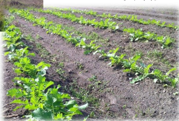
豊田市藤岡地区、猿投地区にて栽培中